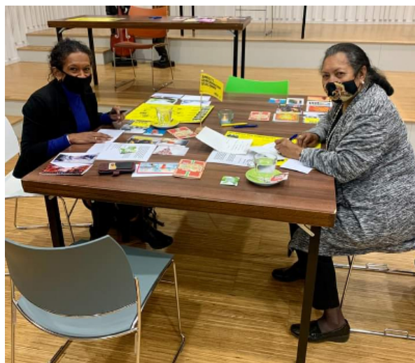
Bibliotheek Zwolle, 10 december 2021 Links onze boekenkraam in de bibliotheek Rechts één van de schrijftafels om kaarten en brieven te schrijven voor West Papua.